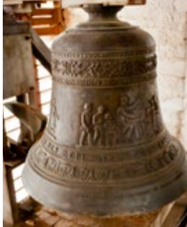
Die ‚Kinder-glocke‘ des Marktkirchengeläutes

Fünf Läuteglocken h^0 - d^1 - e^1 - fis^1 [1962, Gebrüder Rincker] a^1 [1862, Andreas Hamm]. Die Glocken von 1962 tragen Symbole der vier Evangelisten (Mensch-Löwe-Stier-Adler) und ein Wort aus dem betreffenden Evangelium. Vom ursprünglichen Geläut erklingt noch heute die so genannte Kinder-glocke. Eine weitere Glocke ist beschädigt erhalten und dient als Taufstein-Sockel.