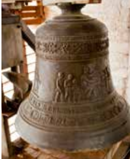
Die „Kinder-glocke“ des Marktkirchen-geläutes

Fünf Läuteglocken h^0 - d^1 - e^1 - fis^1 [1962, Gebrüder Rincker] a^1 [1862, Andreas Hamm]. Die Glocken von 1962 tragen Symbole der vier Evangelisten (Mensch-Löwe-Stier-Adler) und ein Wort aus dem betreffenden Evangelium. Vom ursprünglichen Geläut erklingt noch heute die so genannte Kinder-glocke. Eine weitere Glocke ist beschädigt erhalten und dient als Taufstein-Sockel.