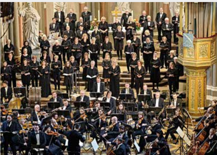
Der Marktkir- chenchor

Wenn Sie die Arbeit des Fördervereins mittragen möchten, können Sie das in Form einer Spende oder durch den Erwerb der Mitgliedschaft tun. Der Jahresbeitrag beträgt EUR 50.- Jede weitere Spende ist herzlich willkommen. Sie erhalten dafür selbstverständlich eine Spendenquittung.